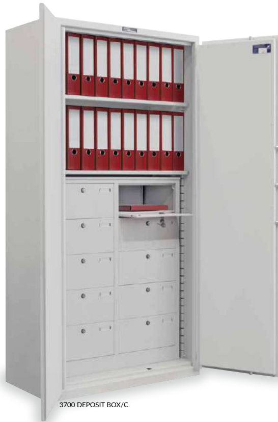
3700 DEPOSIT BOX/C