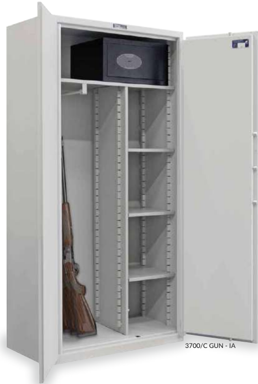
3700/C GUN - IA